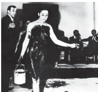
Harry Shunk/John Kender © Roy Lichtenstein Foundation

Immagina di poter pure cedere queste opere con un complesso rituale di cessione. Gli acquirenti di questo limite estremo dell'arte saranno i personaggi più curiosi degli avvenimenti culturali contemporanei: lo vedremo ritratto accanto a Dino Buzzati e a Lucio Fontana. All' Immateriale ed al Vuoto sono dedicate due stanze della mostra.