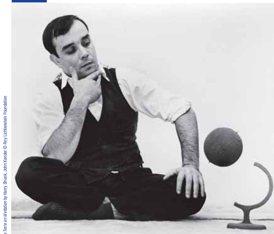
La foto è editata da Harry Shunk, John Kender © Roy Lichtenstein Foundation

un progetto di Sergio Maifredi a cura di Sergio Maifredi e Bruno Corà in collaborazione con Archives Klein, Paris