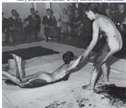
Harry Shunk/John Kender © Roy Lichtenstein Foundation

Lo studio del corpo, del movimento, approfondito in Giappone, prende forma artistica nelle Antropometrie, veri e propri rituali in cui la modella, impregnata in litri di pigmento blu, il brevettato IKB International Klein Blue, applica il proprio corpo sulla tela stesa alla parete o, come un tatami , a terra. Le Antropometrie sono rito e sono teatro. In molti casi si svolgono di fronte ad una ristretta platea di invitati, accompagnati da un'orchestra; Yves Klein, regista e direttore, guida sia il movimento