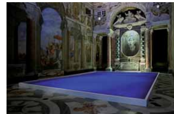
"Pigmento puro"